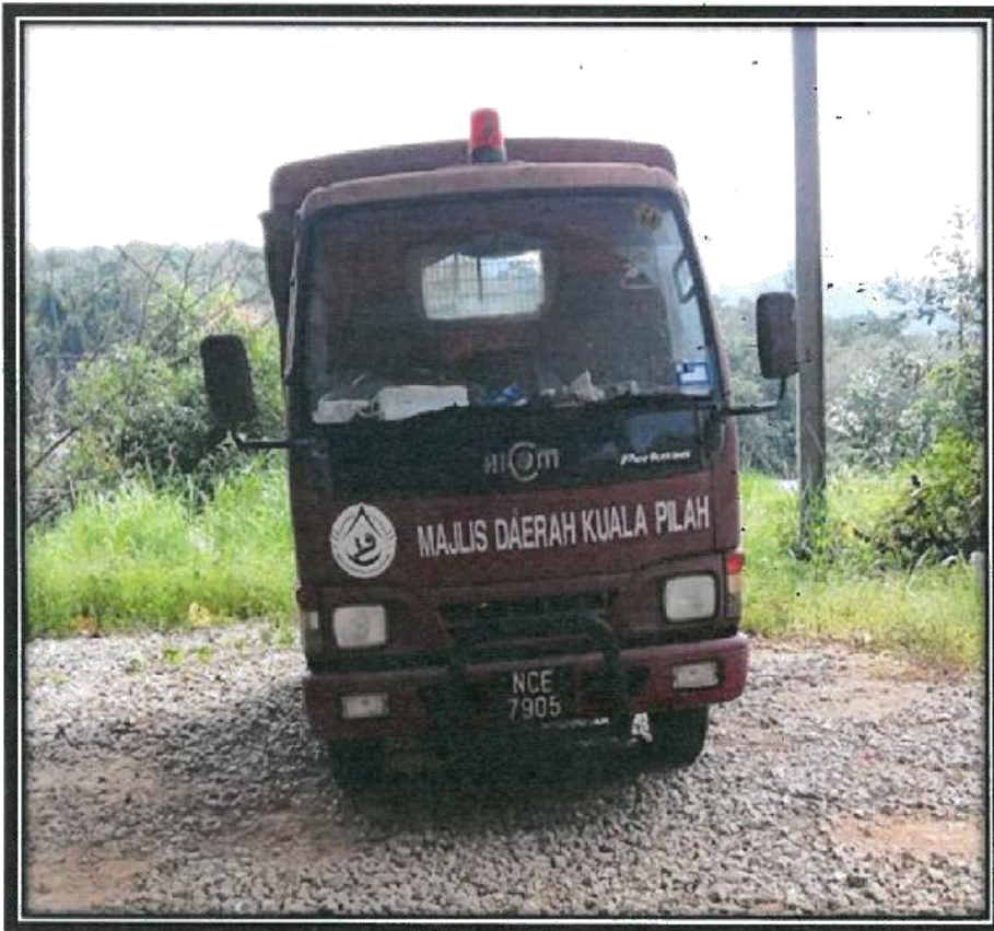
LORI G.V.W - HICOM NCE 7905